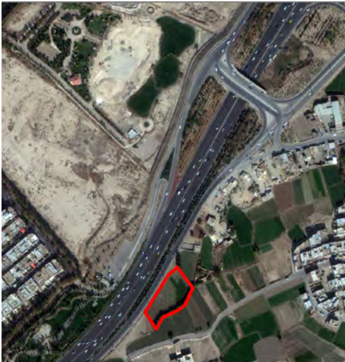
روابط عمومی شهرداری اصفهان منطقه ده