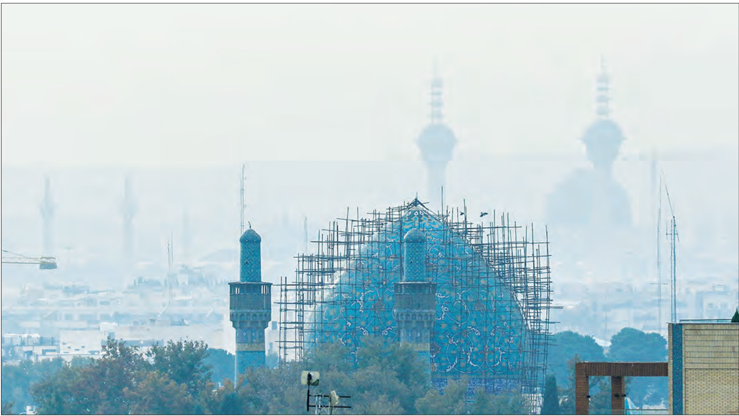
لایلمقیی دبیر گروه جامعه

باد و باران متوقف شد، آلودگی پدیدار شد؛ آیا انتقال نیروگاه به خارج از شعاع ۵۰ کیلومتری چاره‌ساز است؟