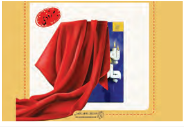
«به وقت جان بازی» به زودی منتشر می‌شود