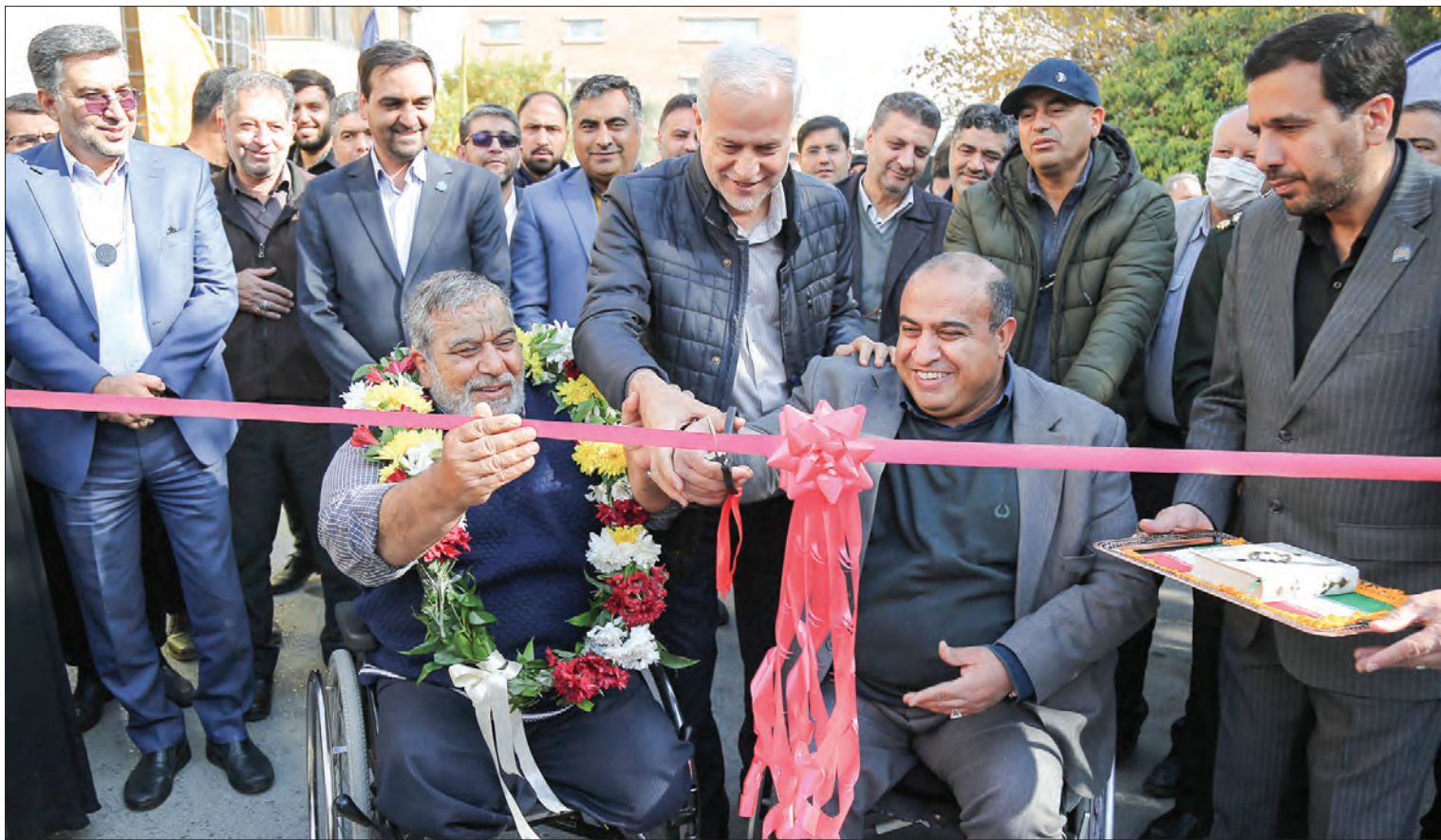
تکسی با همیار به نیتان با

بیست و سومین برنامه «به احترام مردم اصفهان» با محوریت بهره برداری از پنج دستگاه ون ویژه معلولان و سامانه همیار برگزار شد