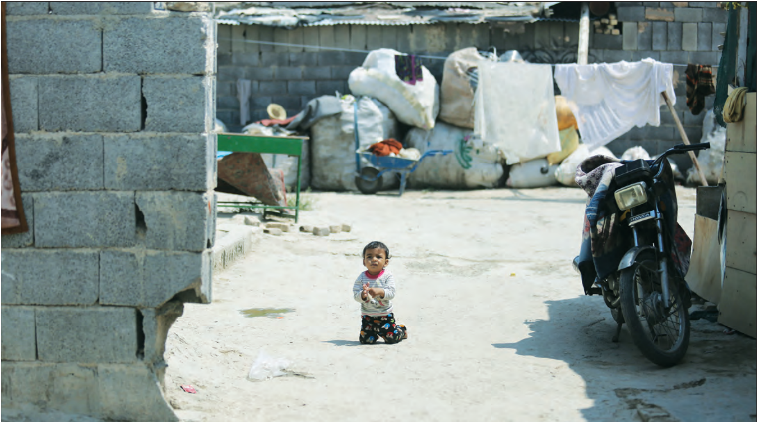
یک کودک بی‌وطن در حاشیه‌نشینی شهر اصفهان.

آیا وضعیت حاشیه‌نشینی در اصفهان با اجرای برنامه هفتم بهبود می‌یابد؟