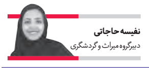
نفسه حاجاتی دبیرگروه میراث و گردشگری

نگاهی به رویداد تازه سازمان نوسازی و بهسازی شهر اصفهان