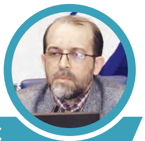
جواد وزیر مشاور وزیر کشور و مدیرکل مطالعات شهری و روستایی سازمان شهرداری‌ها و دهیاری‌های کشور