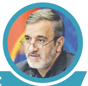
محمد آئینی معاون وزیر راه و شهرسازی