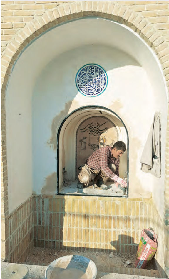
❖ سقاخانه گذر گردشگری حاج‌آقاو‌الله نجفی ❖

احیای بازارچه درب‌کوشک توسط سازمان نوسازی مورد واکاوی قرار گرفت و قسمتی از سنگاب و حوضچه آب احیا شد. این سقاخانه دارای نقاشی دیواری بوده که متأسفانه تخریب شده و شواهدی از آن باقی نمانده است. از این رو تصمیم گرفتیم بر دیوار جنوبی آن از نقاشی مکتب‌سقاخانه