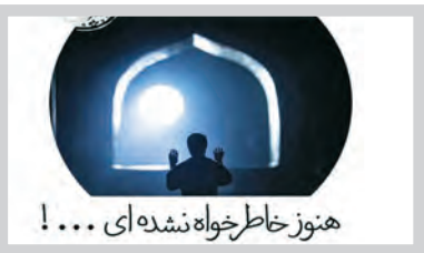
هنوز خاطر خواه نشده‌ای ...!

آیت‌الله حائری شیرازی: از آثار حلال بودن مالتان این است که فرزندتان عاشق شهادت می‌شود. اگر به بچه نان حرام بدهید، بچه هیچ وقت دلش نمی‌خواهد بسیجی شود. آن نان، این اقتصا را نندارد.