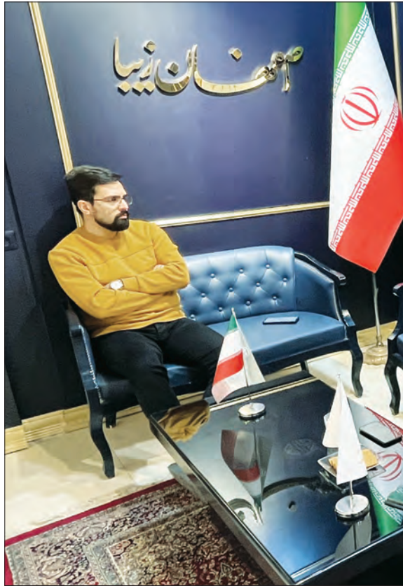
❖ عیاش براساس انجام

شهر اتفاق می‌افتاد، لازم به ایجاد پل نبود. بحث دیگری نیز مطرح بود که می‌گفتند ایجاد خیابان‌های دوطبقه در دنیا منسوخ شده‌است؛ اما چون استدلال این بود که اصفهان باید اولین شهر در ایران باشد که پل دوطبقه می‌سازد، این کار را انجام دادند.