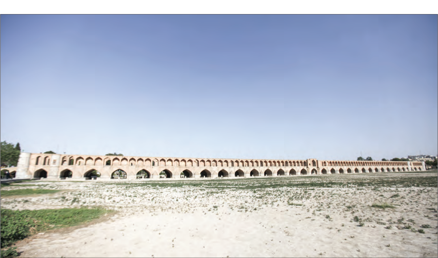
بخش‌های مختلف سد کهنه