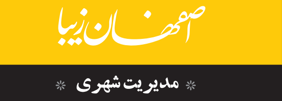
* مدیریت شهری *

رئیس هیئت‌امنا بازار اصفهان اضافه کرد: حق اصفهان نیست که در تهران نسبت به آن کم‌توجهی شود. چه اتفاقی قرار است در اصفهان بیفتد؟ از مسئولان شهری تقاضا داریم به این امر ورود پیدا