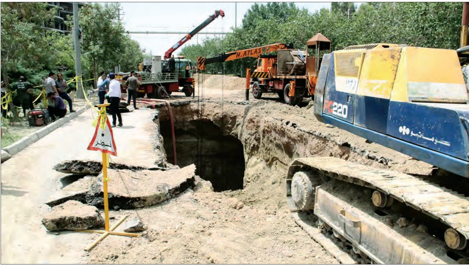
لایلمیعی دبیر گروه جامعه

در هفته‌های گذشته برخی از رسانه‌ها با نقل آمارهایی از یک مؤسسه ناشناس، خبر از کاهش فرونشست دادند آیا روند فرونشست در اصفهان، کاهش یافته است؟