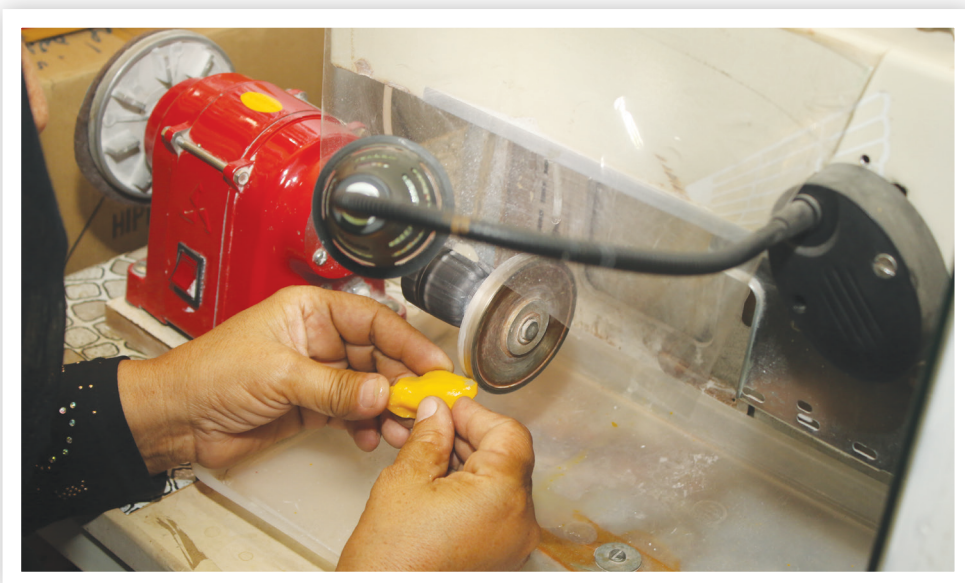
معرفی کارآفرین نمونه منطقه