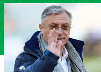
Zlatko Kranjčar (Croatia)