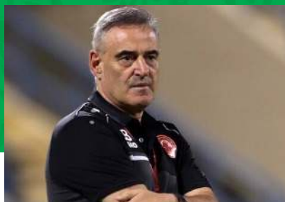
لوکا بوناچیچ (کرواسی)

قهرمانی این مربی برزیلی با تیم ملی عراق در جام ملت‌های آسیا باعث شد تا حضور او در سپاهان یک اتفاق مهم به نظر بیاید؛ اما در دوران حضورش در اصفهان در لیگ هفتم، مربی بزرگی نشان نداد و در جایی که انتظار می‌رفت، از توان فنی‌اش برای زردها استفاده نکرد. این کار را نکرد تا سپاهان در دوره حضور او در لیگ و جام حذفی، جامی کسب نکند. لیگ‌های عربی مقصد بعدی ویرا بود؛ اما با این تیم‌ها هم نتوانست عملکرد خوبی داشته باشد.