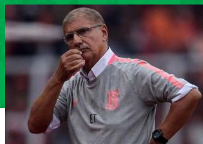
ادسون تاوارس (برزیل)

این مربی که با تیم استقلال قهرمان جام باشگاه‌های آسیا شد و اسم و رسم زیادی برای خود در فوتبال ایران دست و پا کرد، نخستین سرمربی خارجی تیم سپاهان است که در سال ۵۵ هدایت این تیم را برعهده گرفت؛ اما برخلاف حضورش در تهران، در اصفهان با تیمش عملکرد خاصی نداشت و فعالیتش یک سال نیز بیشتر دوام نیاورد.