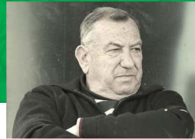
استانکو پوکله پوویچ (کرواسی)

اولین تجربه حضور مربی برزیلی بر روی نیمکت سپاهان در لیگ پنجم به وقوع پیوست و ادسون تاوارس سرمربیگری زردها را برعهده گرفت. سپاهان و تاوارس در لیگ برتر دستشان از کسب جام کوتاه ماند؛ اما در جام حذفی این تیم فینالیست شد. تاوارس که پیش از حضور در سپاهان سابقه مربیگری در تیم ملی ویتنام را داشت، بعد از خروج از ایران نیز مربیگری تیم ملی هائیتی را برعهده گرفت.