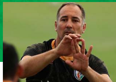
ایگور استیماچ (کرواسی)

لوکا با فولاد خوزستان به فوتبال ایران معرفی شد؛ اما افتخارات او با تیم سپاهان به دست آمد. اولین قهرمانی زردها در جام حذفی با هدایت لوکا رقم خورد و دومین قهرمانی نیز به فاصله یک سال بعد به دست آمد؛ اما او ج کار لوکا در فوتبال کشورمان را باید نایب قهرمانی در لیگ قهرمانان آسیا دانست. لوکا در جام باشگاه‌های جهان نیز هدایت تیم سپاهان را برعهده داشت. او چندی بعد نیز یک بار دیگر هدایت سپاهان را برعهده گرفت؛ اما دیگر خاطرات خوش گذشته تکرار نشد. لوکا در دو مقطع نیز سرمربیگری تیم ذوب‌آهن را عهده‌دار بوده تا مربی باسابقه‌ای در فوتبال ایران محسوب شود.