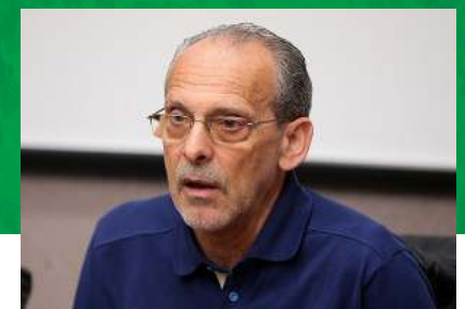
ژوروان ویرا (برزیل)

سپاهان با استانکو در حالی لیگ حرفه‌ای فوتبال را شروع کرد که این مربی سابقه چندساله‌ای در فوتبال ایران داشت و مدیران تیم اصفهانی نیز به واسطه عملکردش به سراغ او رفتند؛ اما رتبه نهمی زردها با استانکو نتیجه مطلوبی نبود و رأی به قطع همکاری داده شد؛ هرچند که برخی کارشناسان بر این باورند نقش این مربی در ظهور نسل طلایی سپاهان را نباید نادیده گرفت. استانکو در لیگ چهارم نیز یک‌بار دیگر سرمربیگری تیم سپاهان را برعهده گرفت؛ اما این بار هم عملکرد خوبی نداشت و همکاری‌اش زودتر از مقطع قبلی پایان یافت.