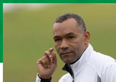
ژوزه مورایس (پرتغال)

کرانچار پس از یک دوره کوتاه حضور در تیم پرسپولیس، این بار به مقصد اصفهان به ایران آمد و خاطره خوشی از خود در فوتبال نصف جهان برجای گذاشت. کرانچار در لیگ یازدهم به سرمربیگری تیم سپاهان انتخاب شد و با این تیم به قهرمانی لیگ برتر رسید. قهرمانی در جام حذفی دومین موفقیت کرانچار با سپاهان بود؛ اما در فصل سوم همکاری به جامی دست نیافت و جایش را به مربی دیگری داد. کرانچار در مقطع دیگری هم هدایت تیم سپاهان را برعهده گرفت؛ اما او و سپاهان نشانی از آن تیم قبلی نداشتند.