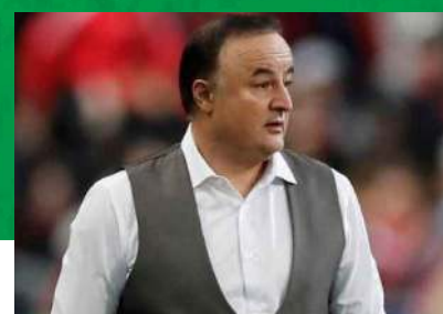
اتگین فیرات (آلمان)

این مربی کروات به ایران آمده بود تا با مدیران تیم استقلال مذاکره کند؛ اما پس از ناکام ماندن در این مذاکره، به لطف مدیر برنامه‌هایش، مقصد اصفهان را انتخاب کرد و برای لیگ پانزدهم هدایت تیم سپاهان را برعهده گرفت. استیماچ که در کارنامه‌اش بازی و مربیگری در تیم ملی کرواسی را داشت، تنها ۱۱ هفته سرمربی تیم سپاهان بود که حتی ۱۱ امتیاز هم از مجموع این دیدارها کسب نکرد. سپاهان با استیماچ در لیگ قهرمانان آسیا هم ضعیف‌ترین عملکرد را به ثبت رساند.