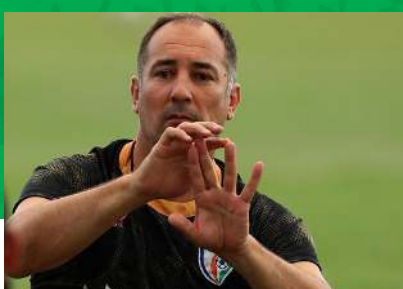
Igor Štimac (Croatia)

After a short period of coaching in Persepolis F.C., Kranjčar moved to Isfahan and later left the city's football with good memories. Under the coaching of Kranjčar, Sepahan F.C. won the 11th Persian Gulf Pro League. Winning the Iran Hazfi Cup was the second achievement of Kranjčar with Sepahan, but his third season of cooperation with the team was not successful, and he was replaced with a new coach.