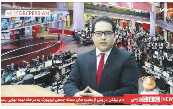
هام لیکن در دیشی آن شبیره های دسته جمعی نیوزورک به مرحله تهیه نهایی رس

گفت‌وگویی با تهیه‌کننده «دی‌بی‌سی» برنامه جدید شبکه دو