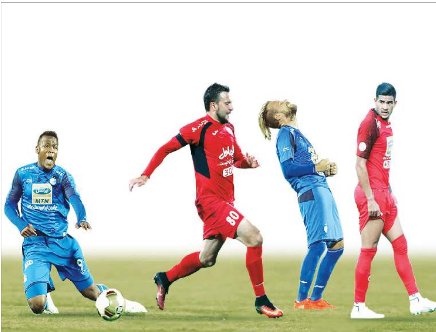
فابی سیو: است

در بازار داغ نقل و انتقال های لیگ برتر فوتبال، خرید بازیکنان خارجی از اخبار دائمی و پرحاشیه آن است و بعضی از مربیان نیز تاکید ویژه ای بر خرید این بازیکنان پیش از شروع مسابقات دارند.