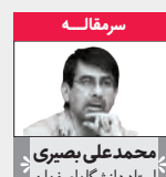
استاد دانشگاه اصفهان