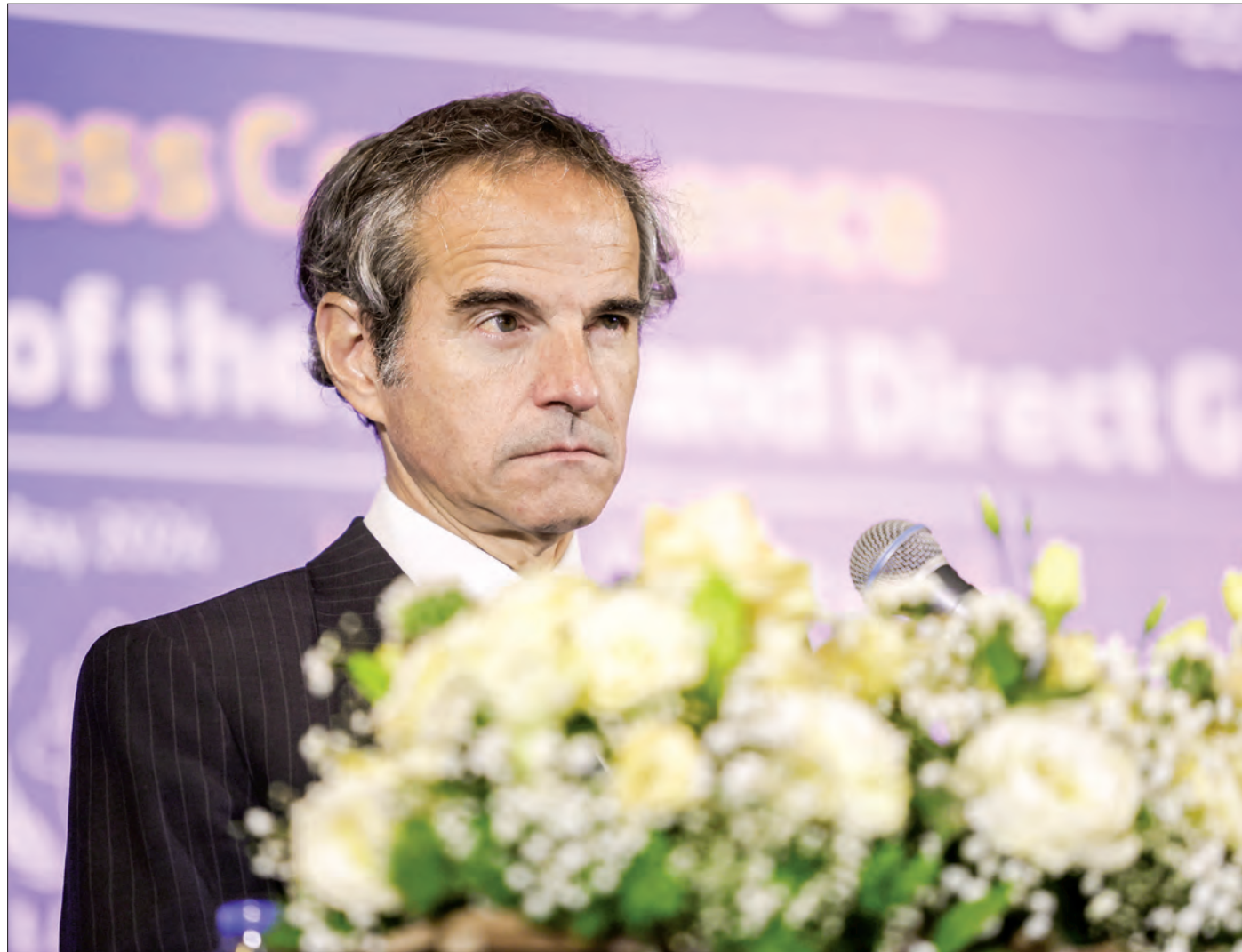
مدیرکل آژانس بین المللی انرژی اتمی در نشست خبری اصفهان به تشریح تلاش های خود در دیدار با مقامات ایران پرداخت