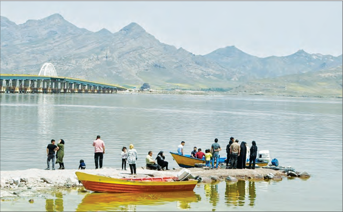
عکس: خورشیدی نسیم ۱