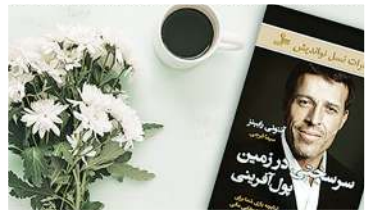
کتاب سرسختی در زمین پول آفرینی

آنتونی رابینز، در کتاب سرسختی در زمین پول آفرینی، بینش‌ها و راهکارهایی را از موفق‌ترین سرمایه‌گذاران در سطح جهان به شما پیشنهاد می‌دهد. این فرصت را از دست ندهید و بکوشید تفاوت آفرینی این کتاب را هرچه بیشتر در زندگی‌تان بیازمایید و احساس کنید. رابینز در کتاب سرسختی در زمین پول آفرینی (Unshakeable) به معنای واقعی استعداد بی‌نظیرش را برای ساده‌سازی موضوع‌های پیچیده به‌کار می‌گیرد. او چکیده دانش و تجربه بهترین و موفق‌ترین سرمایه‌گذاران را در سراسر جهان به‌صورت درس‌هایی کاربردی مطرح می‌کند که هم سرمایه‌گذارانی بی‌تجربه و هم حرفه‌ای‌ها می‌توانند از آن‌ها بهره‌مند شوند.