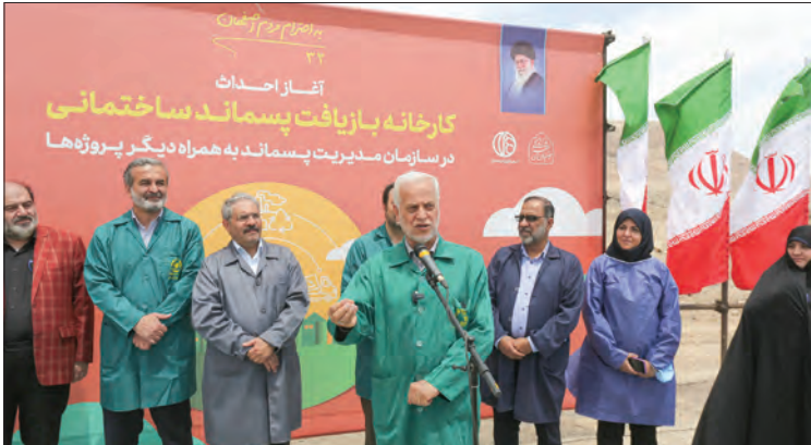
عکس ها از رسانه