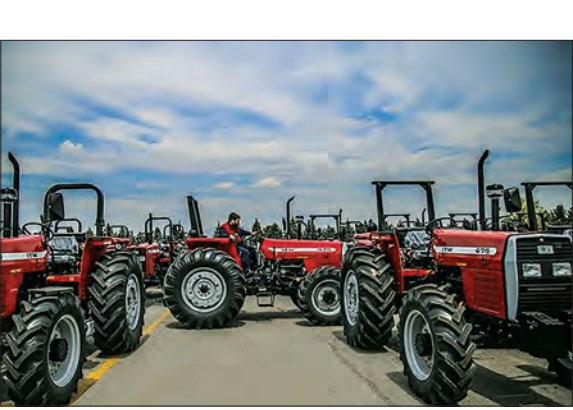
تراکتورهای تراکتورسازی ایران در صف خرید

نیز اشاره کرد و اظهار داشت: از پرداخت تسهیلات توسط بانک‌ها در بخش کشاورزی خصوصاً مکانیزاسیون و صنایع تبدیلی گله‌مند هستیم. خط اعتباری ایجاد شده است. پنج همت رقم مصوب آن است و قرار است هر ماه ۱۰ درصد آن در محل بخش کشاورزی اختصاص یابد؛ اما تنها بانک کشاورزی همکاری‌های