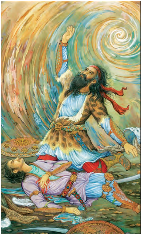
نگارگری هایی از استاد بدرالسماء موضوع شاهنامه فردوسی (داستان کشته شدن سهراب به دست رستم، داستان نبرد سهراب و گرد آفرید و نگارگری حکیم ابوالقاسم فردوسی)