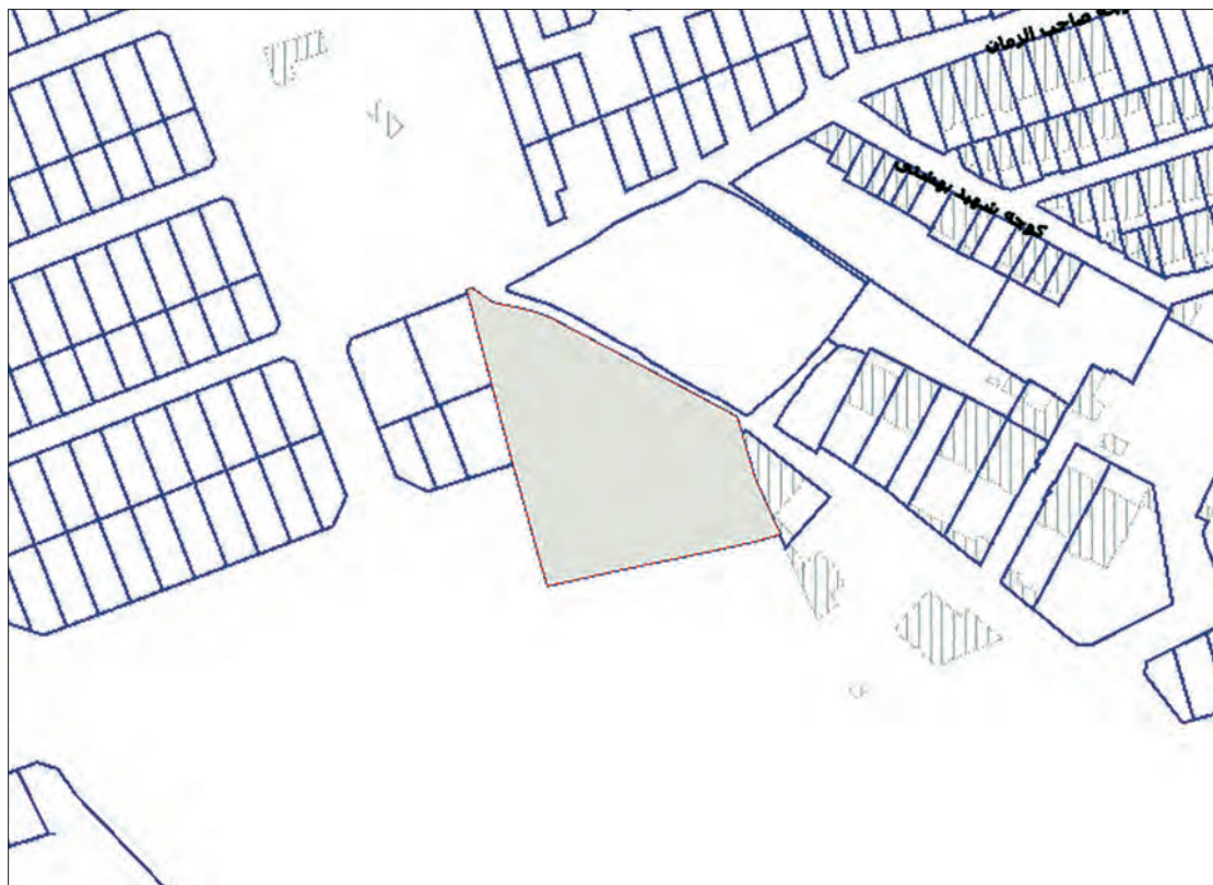
منطقه ۷ شهرداری اصفهان

لازم به ذکر است که کارشناسان می بایست جزء کارشناسان رسمی دادگستری و متخصص در کشاورزی بوده و در مهلت قانونی تعیین شده معرفی گردند . بدیهی است در صورت عدم معرفی کارشناسان برابر مقررات اقدام خواهد شد .