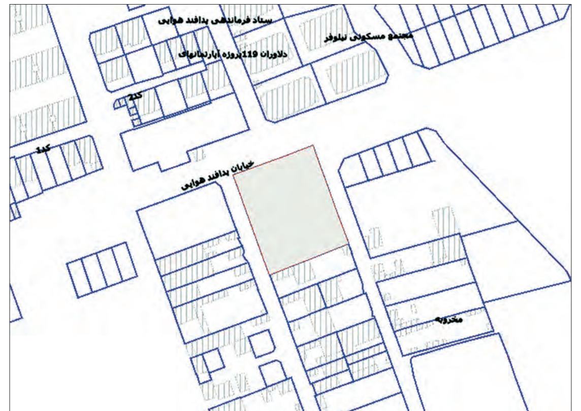
منطقه ۷ شهرداری اصفهان

لازم به ذکر است که کارشناسان می بایست جزء کارشناسان رسمی دادگستری و متخصص در رشته راه و ساختمان بوده و در مهلت قانونی تعیین شده معرفی گردند . بدیهی است در صورت عدم معرفی کارشناسان برابر مقررات اقدام خواهد شد .