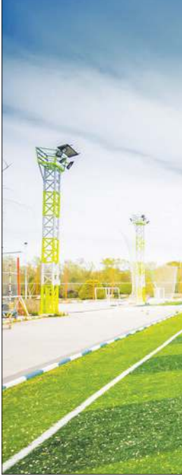
زمین ورزشی روباز در محله های مختلف شهر اصفهان