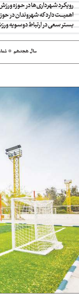
زمین ورزشی روباز در محله های مختلف شهر اصفهان

او با اشاره به سرانه سه ونیم مترمربعی ورزش در جهان و مقایسه آن با اصفهان اظهار کرد: سرانه ورزشی استان اصفهان کمتر از نیم مترمربع است؛ ازاین رو به علت تکلیفی که احساس می کنیم برای افزایش این سرانه