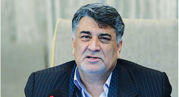
لیلی زوارهای خبرنگار

❖ بررسی و تصویب لایحه ایجاد دو جایگاه پمپ بنزین تک‌سکو یی کوچک در مناطق ۱۲ و ۱۵ در جلسه علنی صدهفتادوچهارم باعث شد تا نگاه‌ها به سمت قرارداد مشارکتی شش سال قبل شهرداری اصفهان، معطوف شود. قراردادی که باعث شد برای نخستین بار در کشور پمپ بنزین تک‌سویی در شهر اصفهان به بهره‌برداری برسد و رنگه، وزیر نفت از آن به شگفتی یاد کند. پمپ‌های بنزینی که باید تا پایان سال ۹۵ به عدد ۵۰ جایگاه می‌رسید، اما تا امروز چنین اتفاقی نیفتاده و در ظاهر کسی دلیل آن را نپرسیده و پیگیری هم نگرفته است. ❖