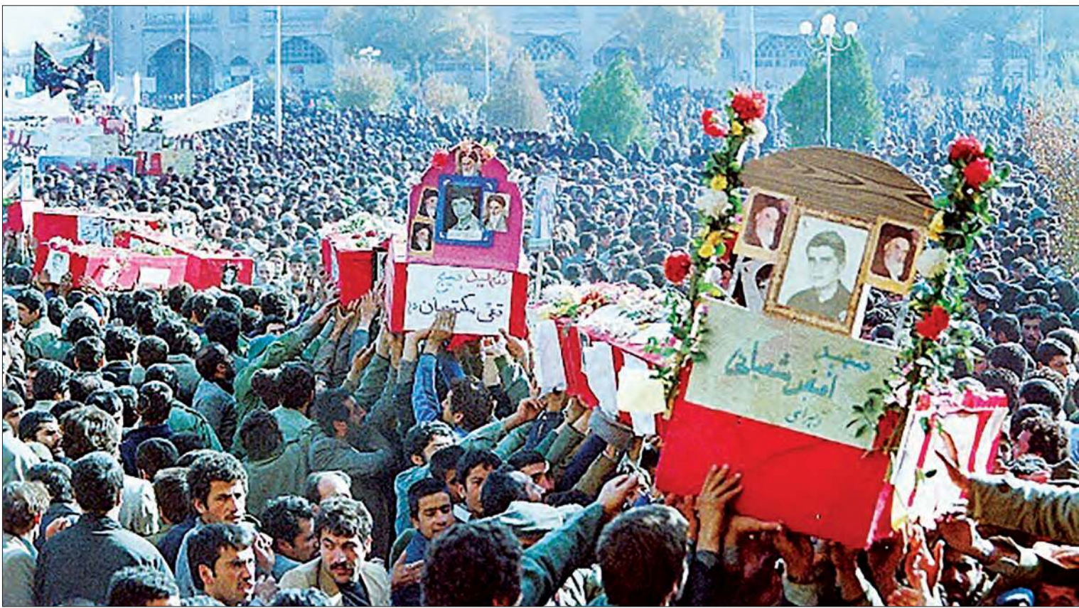
کامران بوده خبرنگار

گروه آوازی «مولا» نواهای خاطره‌انگیزی را به یاد شهدای ۲۵ آبان ۶۱ سازی می‌کند