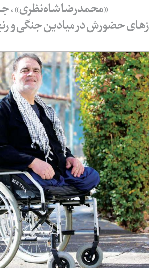
محمد رضا شاه نظری در دوران کودکی

سیم خاردار کشیده بودند. پشت این موانع، توپخانه آن‌ها بود و شهرهای مرزی ما را می‌زدند. فرارشد تحت هر شرایطی توپخانه عراقی‌ها را بگیریم. هیچ راهی برای پیشروی وجود نداشت. پیشنهاد دادند که تعدادی پیش‌مرگ شویم. ما یک تیپ حدوداً ۱۰۰ نفره بودیم که تعداد زیادی از بچه‌ها برای پیش‌مرگی اعلام آمادگی کردند. از بعد از ظهر آماده شدیم. آن شب دقیقاً مثل شب عاشورا بود، خیلی لحظات نابی بود. صبح روز بعد آمدند و گفتند بحث پیش‌مرگی منفی شده. باور نمی‌کنید بچه‌ها چقدر گریه می‌کردند. انگار عزیزترین فرد زندگی خود را از دست داده بودند. آسمان روشن و داغ بود و هوا به‌شدت گرم. یک مرتبه ابرهای سیاهی توی آسمان پیدا شد. در آن شرایط آفتابی، با ریدن تگرگ شیبه معجزه بود و بعد هم به اصطلاح خودمان آسمان غرنبه شد و گویی در آسمان باز شد و باران تکه‌ای می‌بارید. این باران تمام سنگرها، چادرها و سلاح‌هایمان را بر دوتی شیارها و باتلاق‌ها. هنگام اذان مغرب وضو گرفتیم که نماز جماعت بخوانیم. کل منطقه کل ولای بود. در فاصله‌ای که ایستگاه برای نماز چندتا دیگ بزرگ اسپری آورده بودند و تعداد زیادی کنسرو ریختند توی آن تا گرم شد. نماز که تمام شد غذا خوردیم. زمان زیادی بود که غذای گرم نخورده بودیم. کنسروها را که خوردیم، یک تیپ، همه؛ مسموم شدیم. به طور وحشتناکی همه ریختند روی زمین. یک بیابان پر از چناره‌ها شد. دیگر توان حرکت نداشتیم، همه می‌نالیدند درد می‌کشیدند. ۱۲ شب بود که از فرماندهی آمدند و گفتند فرات ساعت ۱ نیمه شب عملیات شود.