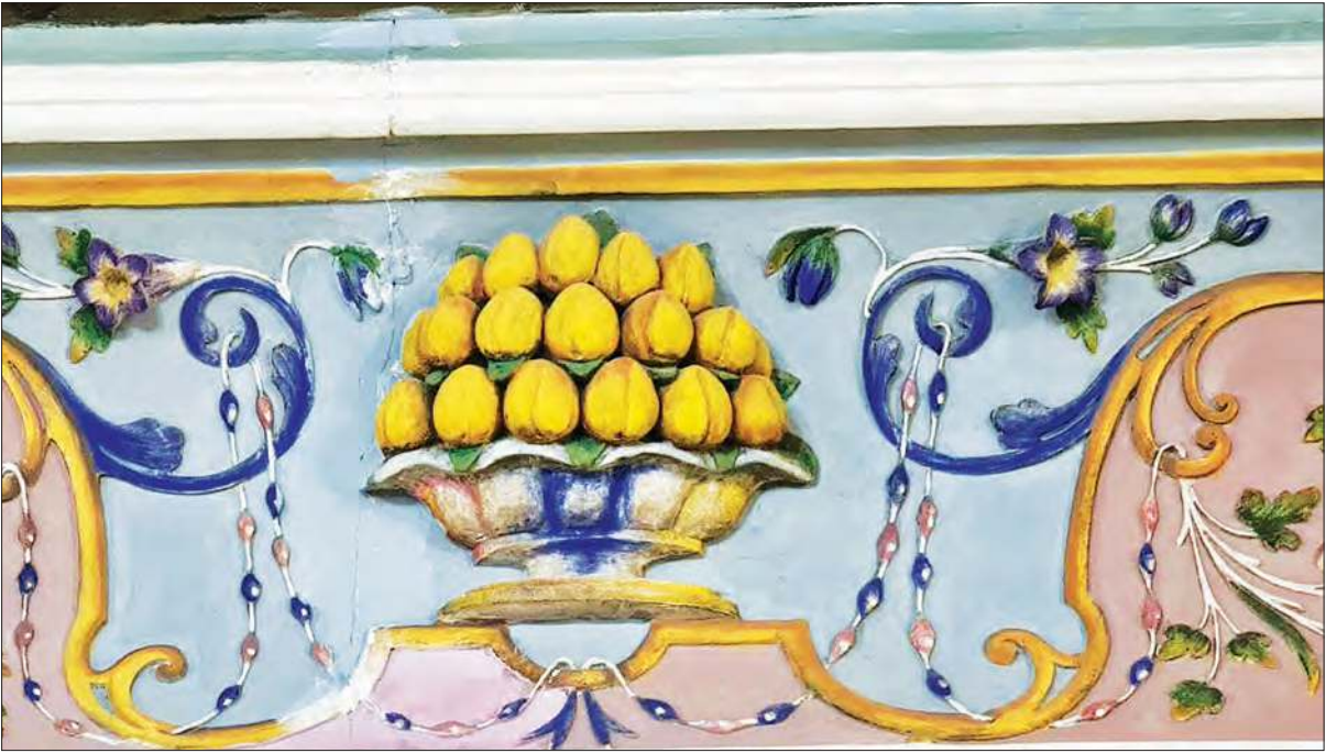
زیادتای باغ زرشک 31