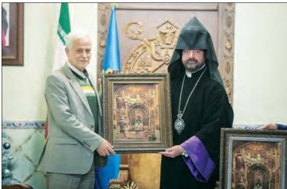
تأسیسات شهرداری اصفهان

بافت‌های تاریخی فرصت بالقوه رونق اقتصادی شهر