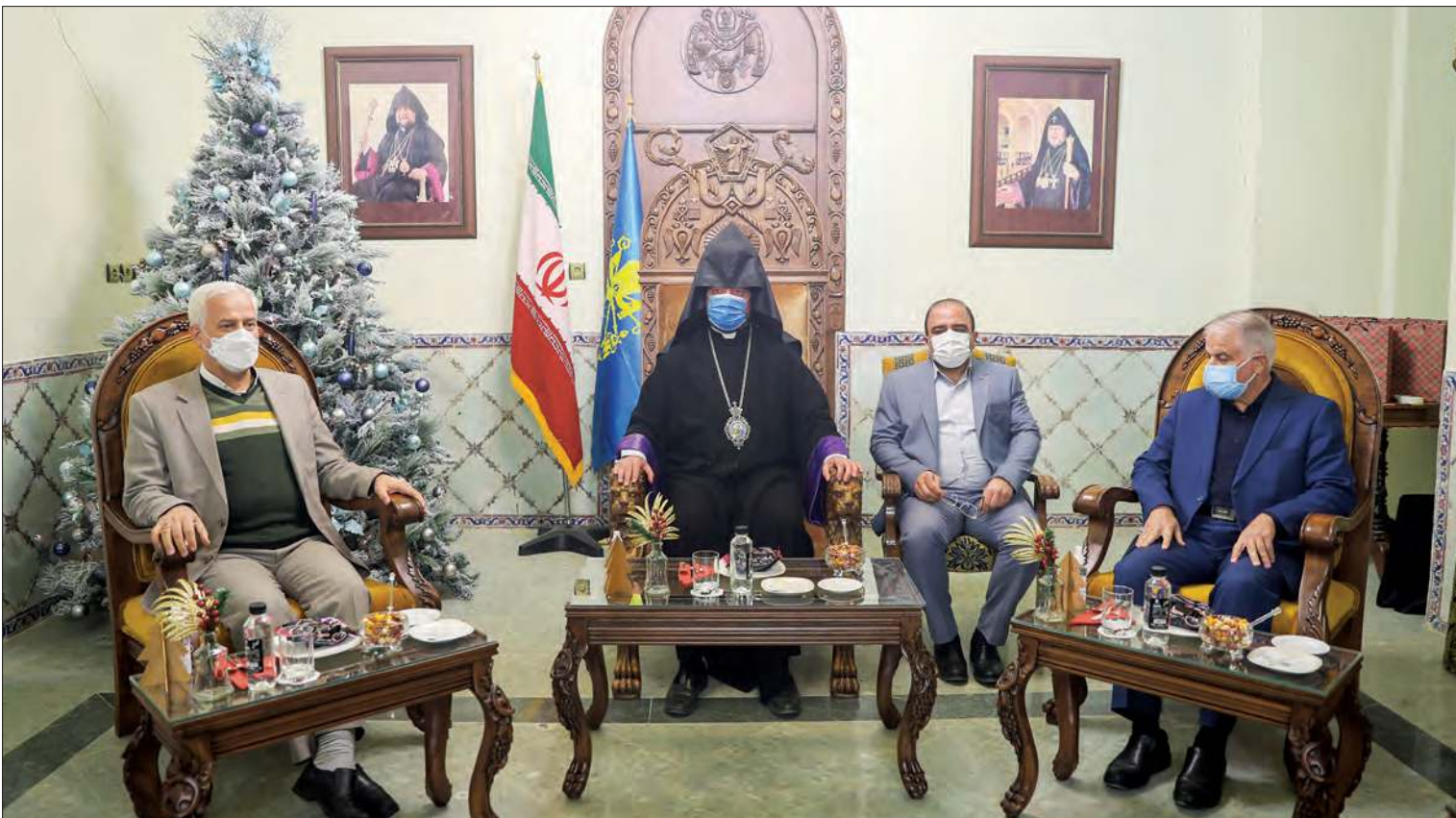
تأسیسات شهرداری اصفهان

اسقف اعظم ارامنه اصفهان و جنوب ایران در بازدید شهردار و اعضای شورای شهر از کلیسای وانک، از اصفهان گفت