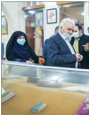
تأسیسات شهرداری اصفهان