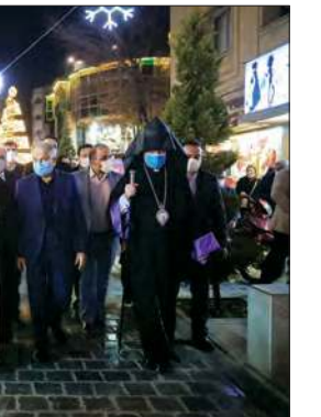
تأسیسات شهرداری اصفهان

* همدلی و تعامل با برگزارگران برنامه‌های مشترک اسقف اعظم ارامنه اصفهان و جنوب ایران هم گفت: حضور اعضای شورای اسلامی شهر و شهردار اصفهان به من و مردم این محله امید داد. امیدوارم این تعامل فرصت‌های بیشتری برای خدمت‌رسانی فراهم کند. امروز به عنوان میزبان دوست دارم حاضران