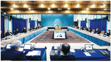
رئیس‌جمهوری ایران، حسن روحانی در جلسه هیئت دولت، در کاخ百合، تهران، ۲۱ اردیبهشت ۱۳۹۴.

رئیس‌جمهور با بیان اینکه «سند تحول دولت» یک سند کتابخانه‌ای نیست، گفت: سند تحول دولت، نقشه راه دولت برای تحول در همه عرصه‌هاست و می‌تواند مبنای برنامه هفتم توسعه باشد. به گزارش فارس، آیت‌الله سید ابراهیم رئیسی روز یکشنبه (۴ اردیبهشت) در جلسه هیئت دولت، با تأکید بر اراده دولت سیزدهم بر تحول آفرینی در همه عرصه‌ها، خاطرنشان کرد: بنای ما از آغاز فعالیت این دولت بر این بوده که اقداماتمان در چارچوب یک برنامه جامع و نقشه راه انجام شود و روزمرگی‌ها بر اهداف کلان دولت، سایه نیندازد. رئیس‌جمهور سند تحول دولت را کاربردی توصیف کرد و گفت: این سند با نگاهی کاملاً کاربردی تنظیم شده است و به هیچ‌عنوان یک سند کتابخانه‌ای نیست؛ درعین حال این سند به دلیل تطابق حداکثری با قوانین و سیاست‌های ابلاغی مقام معظم رهبری، این قابلیت را دارد که مبنای تهیه و تنظیم برنامه پنج‌ساله توسعه هفتم قرار گیرد. رئیس‌ سند تحول دولت را نقشه راه قوه مجریه دانست و گفت: از ابتدای دولت سیزدهم تلاش کرده‌ایم اقداماتمان در چارچوب یک نقشه راه انجام شود و کاملاً قابل ارزیابی باشد.