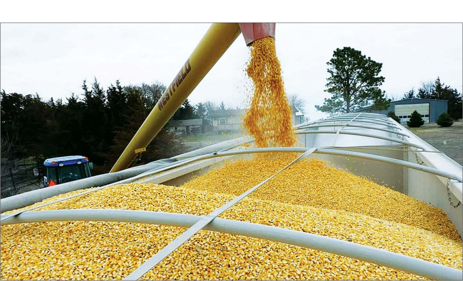
مینابرداری گروه اقتصاد

دست یابند. در این گزارش مشکلات تعاونی‌های منابع طبیعی به‌عنوان یکی از رسته‌های تعاونی‌های کشاورزی از زبان فعالان این بخش بیان شده است: