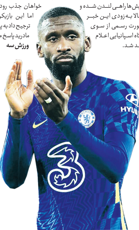
مادرید پاسخ مثبت دهد. / ورزش سه

آینده آنتونی رودیگر، ملی‌پوش آلمانی در ماه‌های اخیر در حاله‌ای از ابهام قرار داشته و در نهایت توماس توخل، سرمربی چلسی دیروز تأیید کرد که این بازیکن در پایان قراردادش در فصل تابستان امسال استمفورد بریج را ترک خواهد کرد. حالا فابریتزو رومانو در گزارشی مدعی شد آنتونی رودیگر ۲۹ ساله برای پیوستن به رئال مادرید با قراردادی بلندمدت به توافق شفاهی با این باشگاه دست یافته و بدین ترتیب اولین خرید مهم کلهکشان‌ها در فصل تابستان قطعی شده است. جزئیات نهایی به زودی مورد توافق قرار خواهد گرفت و رودیگر برای این انتقال به جمع بندی نهایی دست یافته است. حتی تیم پزشکی باشگاه رئال مادرید برای انجام آزمایش‌ها راهی لندن شده و احتمالاً به زودی این خبر به صورت رسمی اعلام خواهد شد.