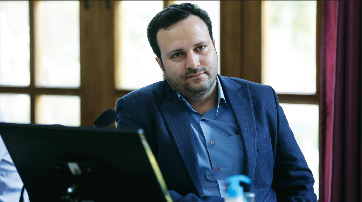
عکس شهردار اصفهان

نباتی نژاد: اعضای شورا، شهردار و مدیران شهری بر تسریع عملیاتی شدن این اقدامات اهتمام ورزند