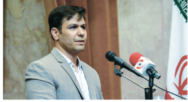
جام مولای عرشیان بانوی قدسیان نقطه‌انگیزه‌ای برای پیشرفت ورزشکاران