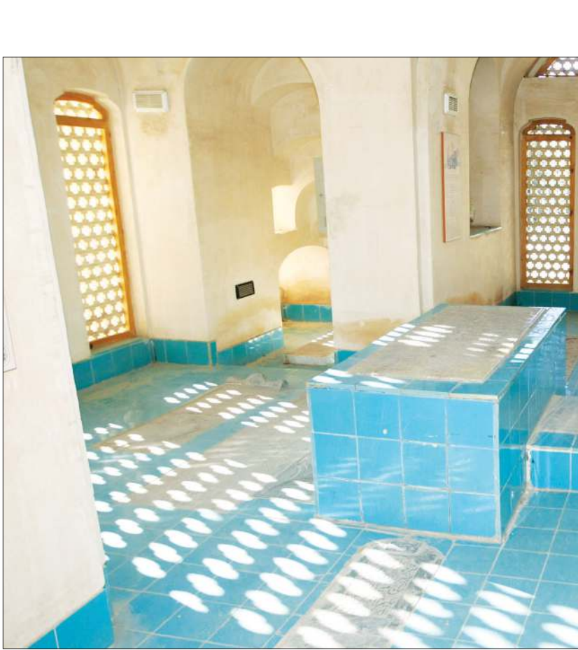
عکس از مسجد نبوی

اجرای ظواهر شریعت به نحو‌حالی از فهم باطنی قناعت کرد. دیگری به نام فلسفه، جان عقل تشنه‌اش را به لب رساند؛ ولی جرعه‌ای از آب هدایت شریعت به او نچشانَد و اهل زهد و اهل عرفان را احمق دانست؛ و آخری به نام عرفان و تصوف، پرده‌های حیای الهی را درید و از حرام خدا حذر نکرد و اهل شریعت عقلانی را دون‌مایه شمرد.