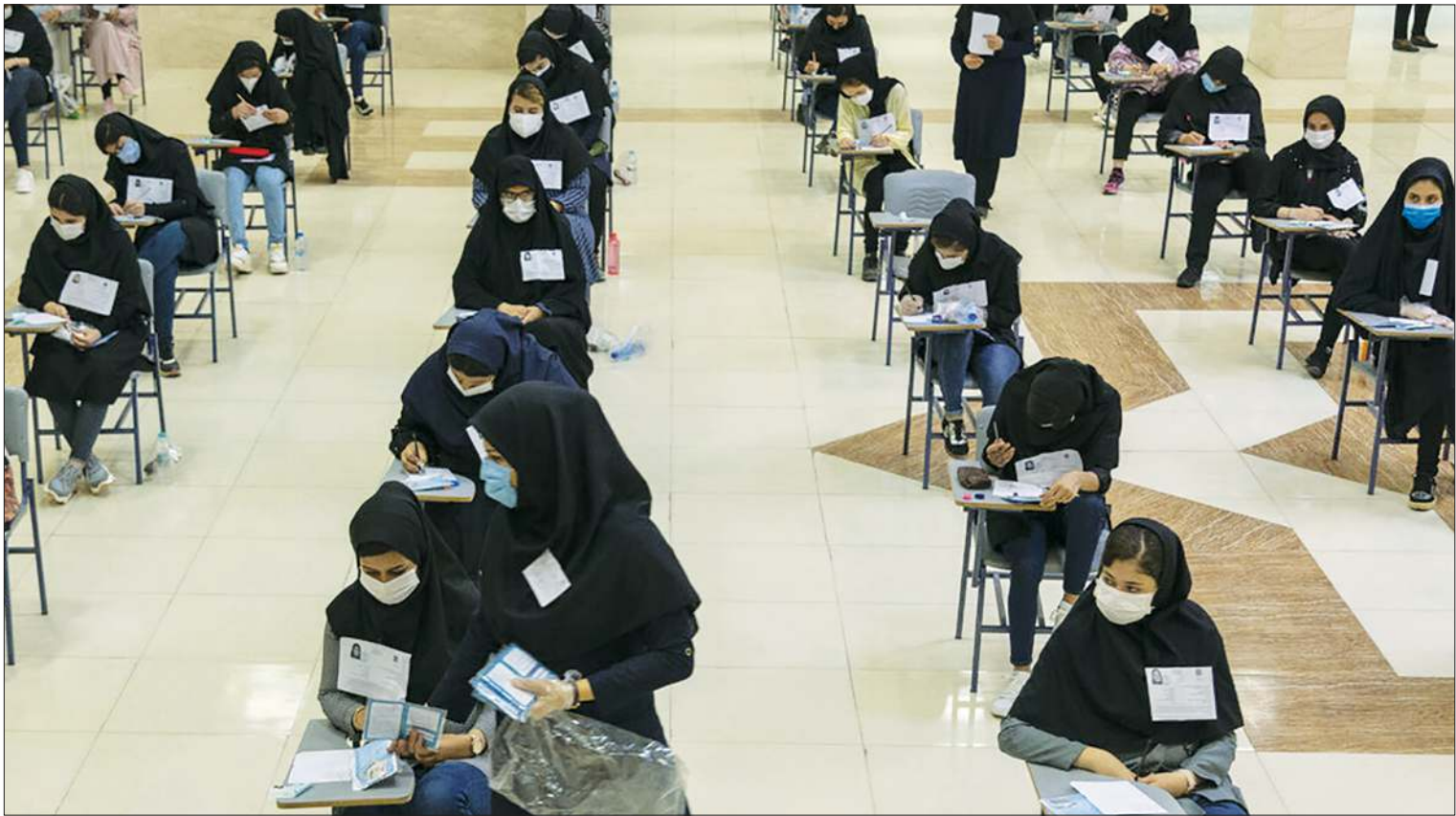
یلماقیمی مدیر گروه جامعه

بالاخره صدای دانش آموزان بلند شد؛ دانش آموزانی که در مناطق محروم زندگی می کنند و جزو اقشار بی بضاعت جامعه هستند و نامشان در فهرست رتبه های ممتاز و برتر آزمون سراسری به چشم نمی خورد. آن ها حالا سکوت خود را شکسته اند و به مصوبه جدید شورای عالی انقلاب فرهنگی در رابطه با کنکور که به اعتقاد بسیاری از طبقاتی شدن این آزمون منجر خواهد شد، اعتراض کرده اند. یکشنبه گذشته بود که جمعی از این دانش آموزان به همراه برخی از نمایندگان مجلس و احمد توکلی که رئیس دیده بیان شفافیت تهران تجمع کردند و با در دست داشتن پلاکاردهایی با مضمون «نه به بی عدالتی آموزشی» و «ما دیگه پول نداریم برای معدل بگذاریم» و «نه به تأثیر قطعی معدل» اعتراضشان را به این مصوبه اعلام کردند. تیرماه گذشته بود که مصوبه جدید شورای عالی انقلاب فرهنگی، پس از مدت ها کشمکش و مخالفت و موافقت و تکذیب سازمان سنجش ابلاغ شد. بر این اساس، نمره کل آزمون اختصاصی، میانگین وزنی نمرات تراز شده دروس تخصصی در هر گروه آزمایشی است. این آزمون