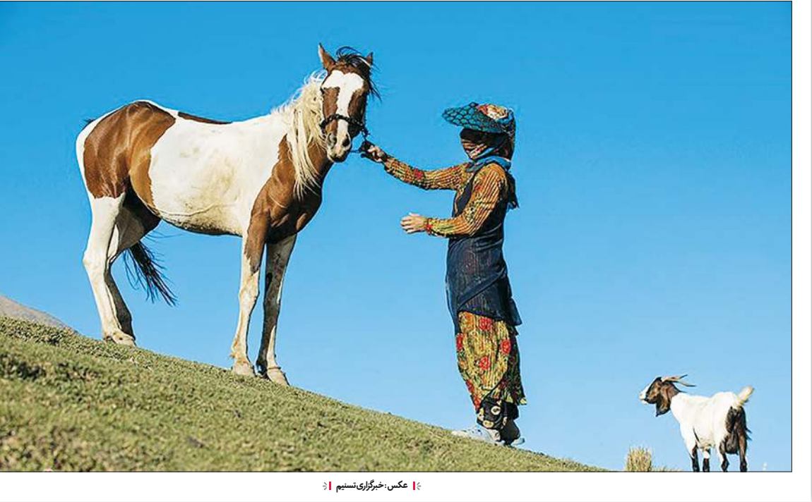
🌟 عکس: خبیرزهی نسیم |

علاوه بر این امسال چهار نقطه تعیین شده در صحن حضرت زهرا (سلام الله علیها) به درمانگاه های موقت تخصیص داده شده است. این صحن دارای هزار چشمه سرویس بهداشتی برای استفاده زوار است.