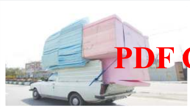
فرحناز مقدس خو