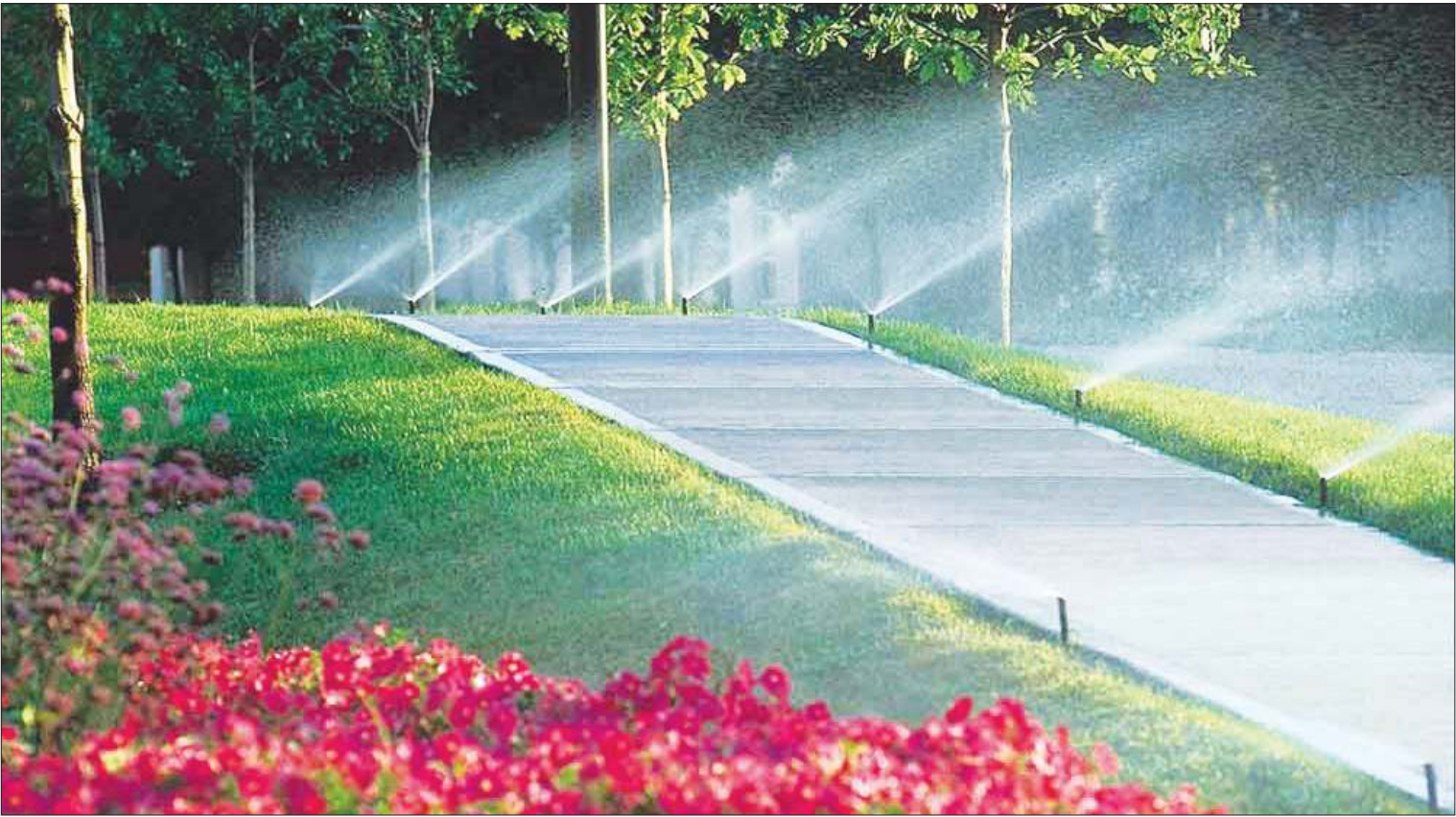
فضای سبز گلشهر

مدیریت نادرست آبیاری، مهم‌ترین عامل ایجاد خسارت به فضای سبز شهری است