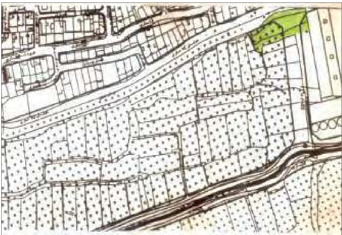
منطقه ۱۱ شهرداری اصفهان