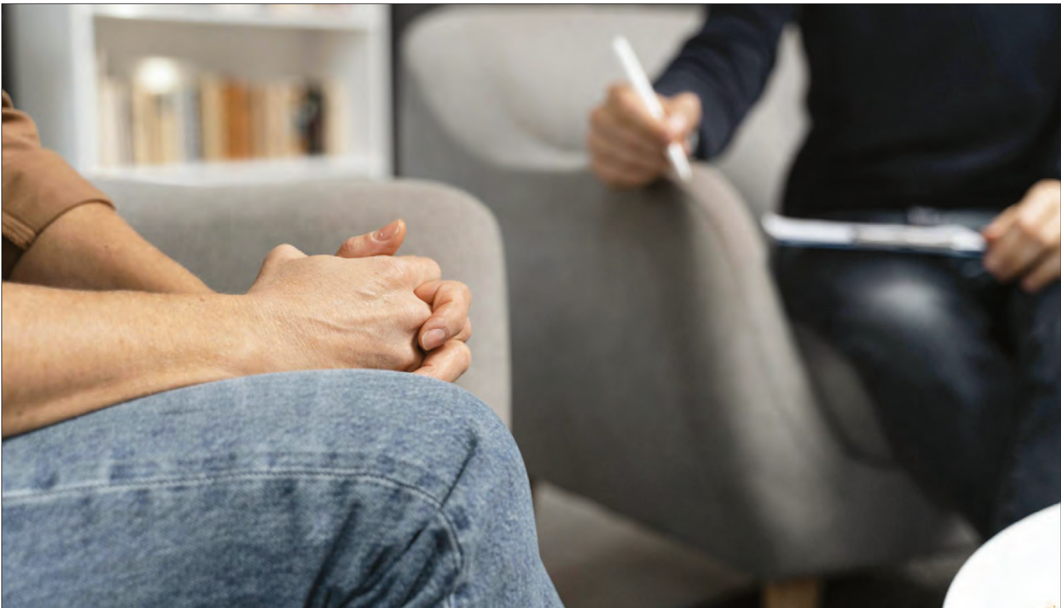
لیلاقمی دبیر گروه جامعه

بررسی هانشان می‌دهد بیمه‌ها به‌رغم اعلام وزارت بهداشت، هزینه‌های روان را پرداخت نمی‌کنند