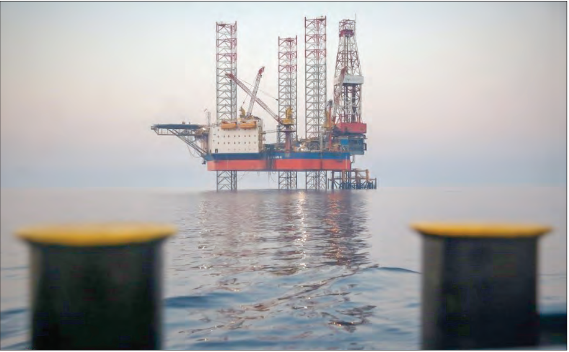
عکس: ترسیم ۱۴