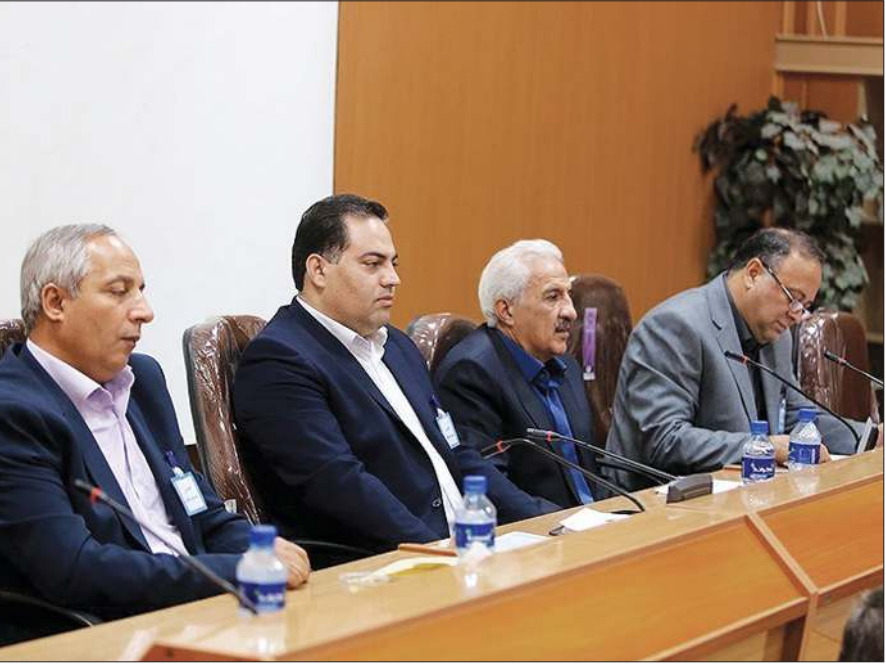
۱۴ شهریورماه کاندیدهای فوتبال است