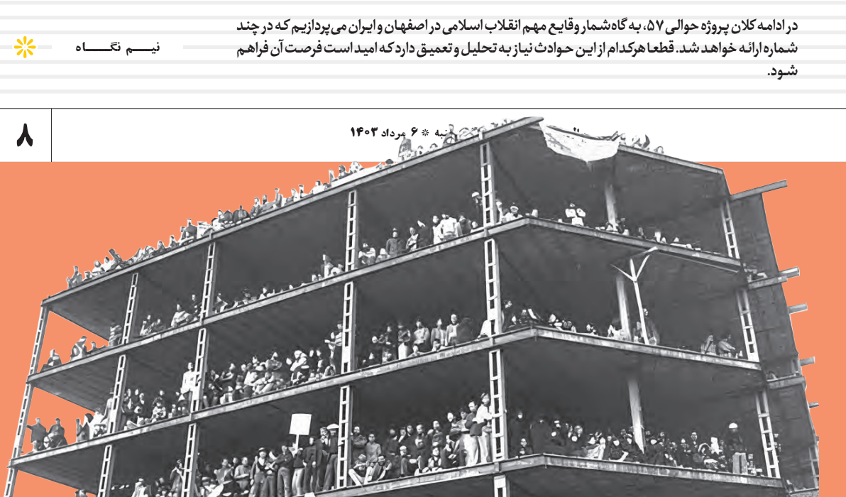
شنبه ۶ مرداد ۱۳۰۳

آنچه در ادامه می‌خوانید، حاصل ده‌ها ساعت مطالعه نویسندگان در میان منابع است که وقایع مهم انقلاب اسلامی در کشور و اصفهان را به صورت گاه‌شمار در چند شماره به علاقه‌مندان ارائه خواهیم داد. قطعا هر کدام از این حوادث نیاز به تحلیل و تعمیق دارد که امید است فرصتی برای نگارش آن‌ها فراهم شود.