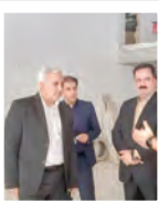
رئیس منطقه ۶ سازمان

آبی خدمات ارزنده‌ای به شهروندان ارائه خواهد شد.