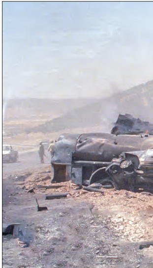
فرماندهان باختران در حال گزارش گرفتن