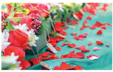
شهدای گمنامی که در پارک ساحلی منجیل استان گیلان، پارک

شهدا شهرستان اشهراد البرز و گلزار شهدای شهرستان سپیدان استان فارس به خاک سپرده شده بودند، شناسایی شدند. در جریان شناسایی هویت شهدای گمنام تدفین شده در برخی از نقاط کشور از طریق آزمایش ژنتیک، پیکرهای مطهر سه شهید گمنام که در گلزارهای شهدا و یادمان ها به خاک سپرده شده بودند، شناسایی شده و مسئولان استانی به خانواده این شهدا اطلاع دادند.