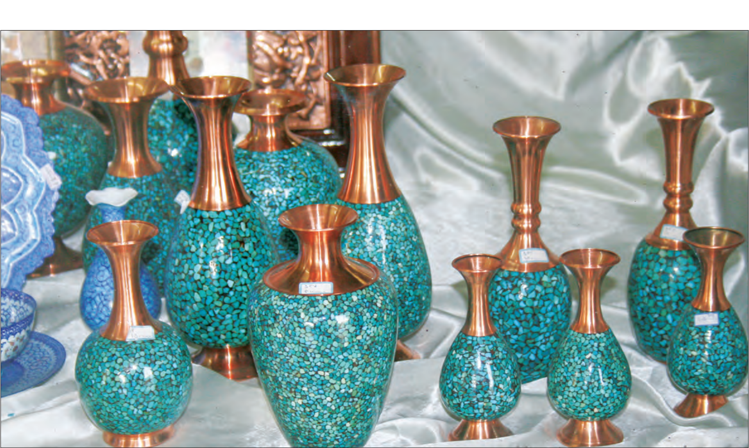
عکس از هنرمند کوبیدم

گفت‌وگو با هنرمندان فیروزه‌کوبی در یکی از بازارهای قدیمی اصفهان