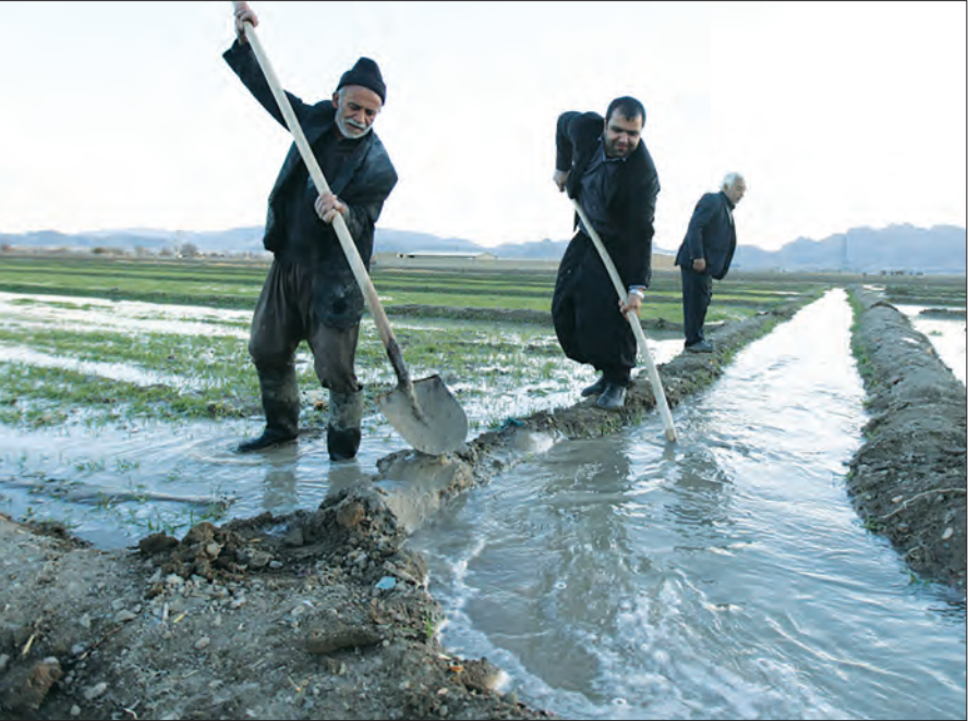
کشاورز صومالی در حال آبیاری