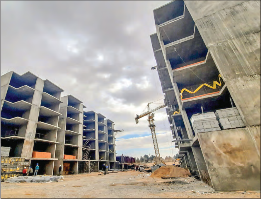
نمای ساختمان مسکن مسکن ملی