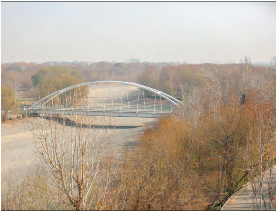
عکس از میدون تپانوم

حدود بیست روز از آغاز فصل پاییز گذشته و هنوز نه خبری از کاهش دماست و نه بارانی باریده؛ پاییزی مشابه با آنچه در سال گذشته و این موقع سال پشت سر گذراندیم و سبب شد تا آن رایگی از گرم ترین پاییزها در سال های گذشته بنامند.