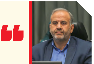
رسول میرباقری رئیس کمیسیون عمران، معماری، شهرسازی و بافت تاریخی شورای اسلامی شهر اصفهان

او بیان کرد: لازم است مدیریت لازم از جانب حوزه شهرسازی و مالی انجام شود تا نیروهایی را از ستاد به مراکز شلوغ اعزام کنند و در شب عید به مشکلات مردم در مناطق رسیدگی شود.