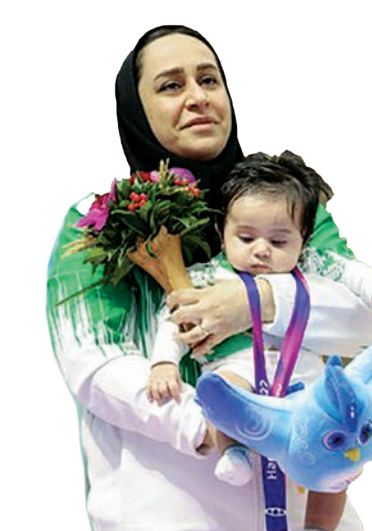
عکس از محمدرضا شریف

پارالمپیک پاریس به طور رسمی اعلام کرد که از دبای قهرمانی خدا حافظی می کند. پایان فعالیت او آغاز یک دوره جدید در این رشته است، دوره ای که کمیته ملی پارالمپیک و فدراسیون جانبازان می توانند استفاده از دانش این قهرمان بزرگ به تربیت نخبگان دیگری در این رشته بپردازند. او اکنون نامی ماندگار در ورزش ایران شده و تمبر یادبود او نیز ضرب شده است. دانش و تجربه جوانمردی موجب شد تا جلیل کوهپایه زاده، رئیس فدراسیون جانبازان و توان یابان، در حکمی این قهرمان پرآوازه ایرانی را به عنوان عضو افتخاری هیئت رئیسه این فدراسیون منصوب کند. / ایرنا