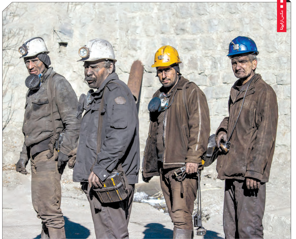
عکس از نیوا

«شیرفالشمس» ماجرای شلوغی بازار انگشتر در ۱۹ فروردین چیست؟ چهارده پاره دارد؟