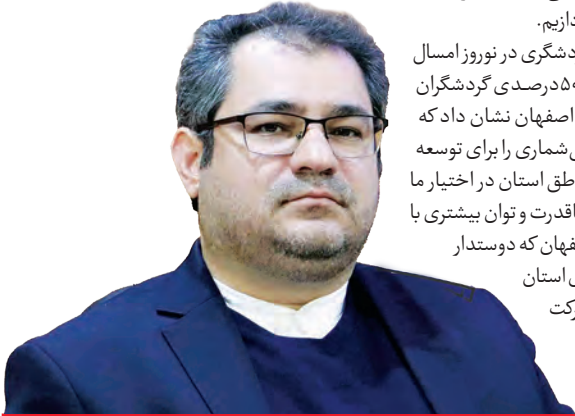
مدیرکل میراث فرهنگی، صنایع دستی و گردشگری استان اصفهان

میراث فرهنگی و گردشگری استان است، به این سمت حرکت می‌کنیم.