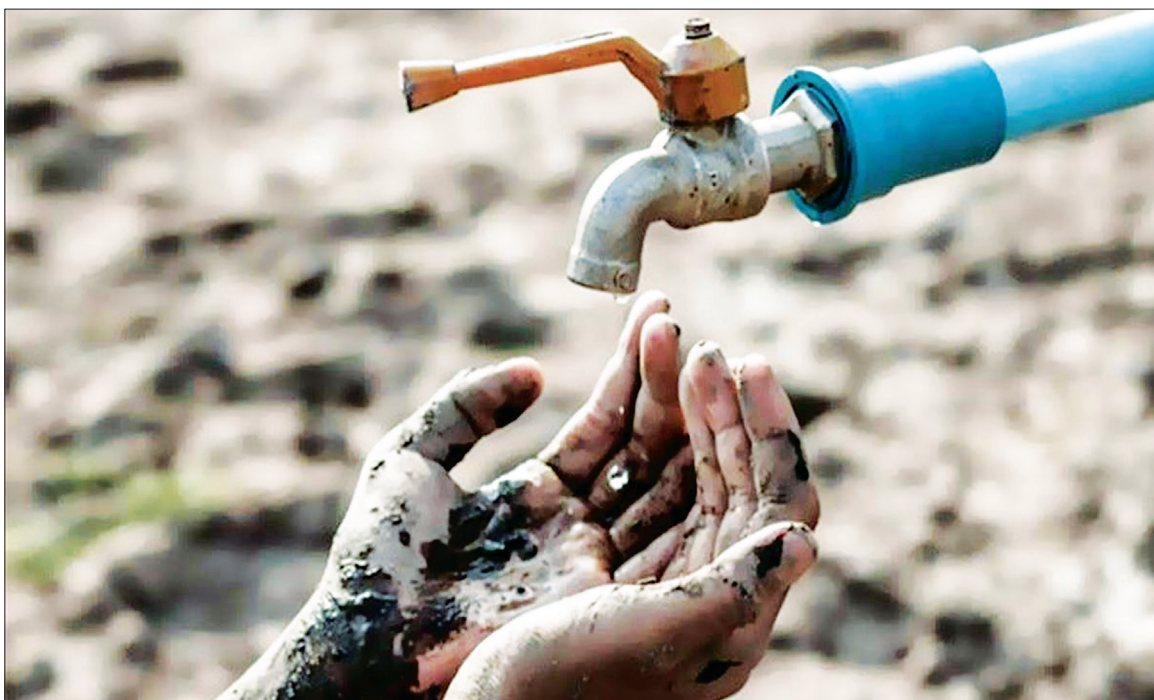
ریحانه سجادی خبرنگار گروه جامعه

به گفته مدیرعامل آبفا اصفهان، عدم بارش در ماه‌های آینده تأمین آب شرب را با مخاطره روبه‌رو می‌کند