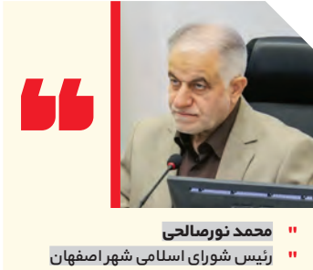
محمد نورصالحی رئیس شورای اسلامی شهر اصفهان