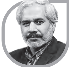
شرف لک زابی، دانشیار گروه فلسفه سیاسی پژوهشگاه علوم و فرهنگ اسلامی

اما آنچه برای بحث ما از لحاظ جامعه‌شناختی مهم است، این است که در یک دوره تاریخی حساس، بخشی از روحانیت شیعی که مستقل از حکومت بوده و به سیم خود از اوضاع زمانه آگاهی داشته و نسبت به انتحام وظیفه دینی و سیاسی در قبال مردم، میهن و خدا، احساس مسئولیت شرعی و مدنی می‌کرده، در برابر قدرت استعماری روس، انگلیس و استبداد شاهی مقاومت می‌کنند و از طریق مکانیزم فتوای مذهبی سعی داشتند تا مانع از تحقق اهداف ضدملی و ضددینی حکومت و قدرت‌های بیگانه شوند. کافی است به تئوریک مندرج در متن فتوای کوتاه، اما تأثیرگذار تحریم مصرف تنباکو توجه کنیم تا متوجه این مدعی شویم. در متن فتوا چنین آمده است: «الیوم استعمال تنباکو و توتون به ای تحکان در حکم محاربه با امام زمان علیه‌السلام است». بنابراین وفق مقتضیات آن زمان که ایران دارای جامعه‌ای سنتی بوده و الزامات فرهنگی، اجتماعی و اقتصادی خاص خودش را داشته، تأثیر این نوع فتواها از سوی روحانیون طراز اول و مراجع تقلید مطرح، موجه، معتبر و ذی‌نفوذ از جمله میرزای شیرازی و میرزای آشتیانی آخوند خراسانی، میرزای نایینی، سید حسن مدرس و آیت‌الله خمینی، رهبر انقلاب اسلامی، می‌توانسته منجر به تحقق اهداف فتوا و لغو قرارداد‌های حکومت با بیگانگان و نیز تحکیم موقعیت فتاوی‌های مذهبی و احکام سیاسی و فرمان‌های اجتماعی فرهنگی در میان مردم و اجتماعات دینی و مذهبی شود.