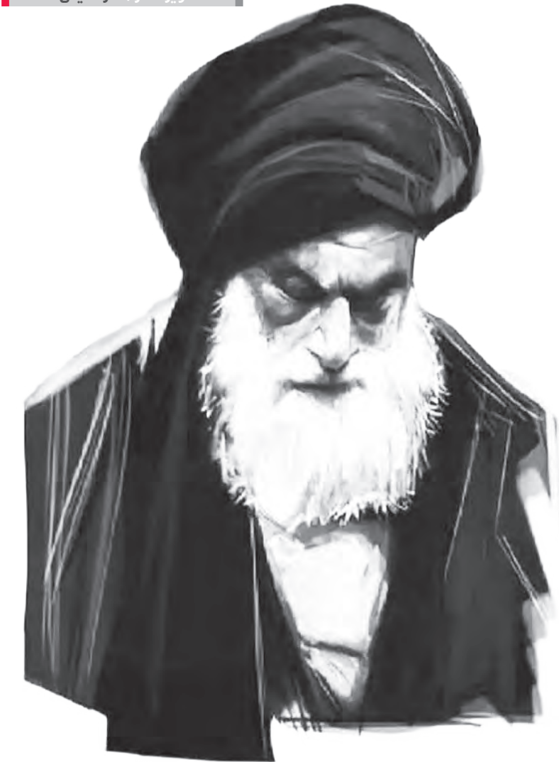
آیت‌الله العظمی آیت‌الله روح‌الله خمینی

بررسی گستره نفوذ و قدرت فتاوی مرجعیت دینی در گذشته و حال به بهانه سالروز صدور فتوای تحریم تنباکو