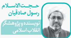
حجت الاسلام رسول صادقیان توسیسده و پژوهشگر انقلاب اسلامی

البته تحقق چنین الگویی از حکمرانی حتماً با موانعی همراه است که مهم‌ترین آن، فقدان یا کمبود حاکمان و کارگزاران معتقد و توانمند است.