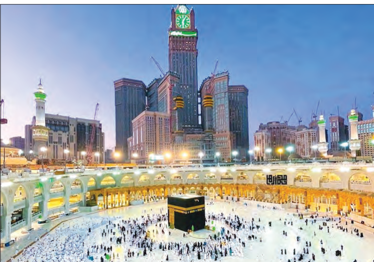
محمدحسین امینی هرندی