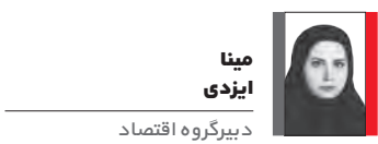
دبیر گروه اقتصاد

روز جهانی کارگر بهانه‌ای است برای مرور سختی‌های زندگی قشر کارگر و تلنگری است برای مسئولان تا با یادآوری هزار توی این مصائب در عمل عزمشان را جزم کنند. افسار تورم، از هم گسیخته است و دستمزد کارگران تناسبی با این تورم ندارد. خبر از افزایش قیمت‌ها می‌دهند. داده‌های مرکز آمار نشان می‌دهد دو کالای بر مصرف مردم یعنی برنج و مرغ صدرنشین افزایش تورم شده‌اند. این افزایش قیمت‌ها حالا چرخ زندگی را برای کارگران سخت‌تر می‌چرخاند. افزایش قیمت اقلام خوراکی در حالی است که اجاره‌بها درصد زیادی از دستمزد کارگران را می‌بلعد. بر اساس داده‌های مرکز آمار ایران، تورم