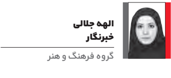
الهه جلالی خبرنگار