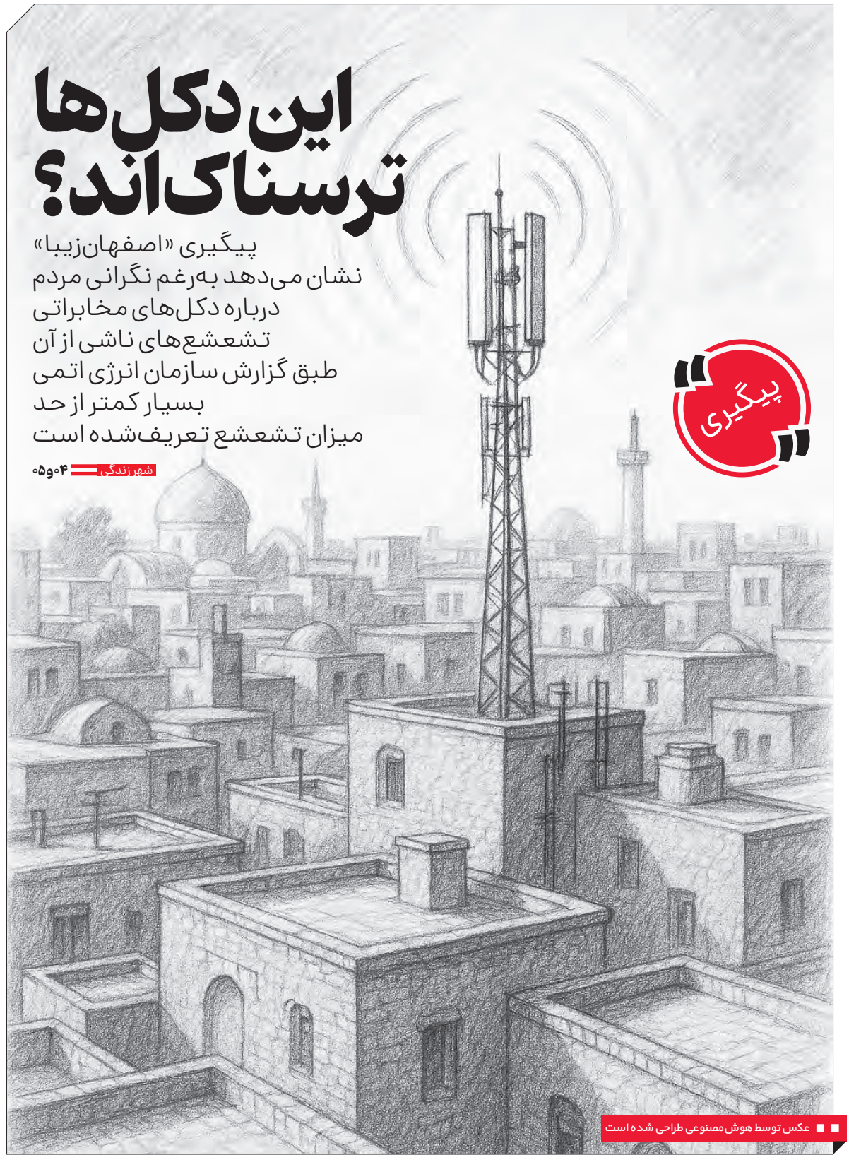
عکس توسط هوش مصنوعی طراحی شده است