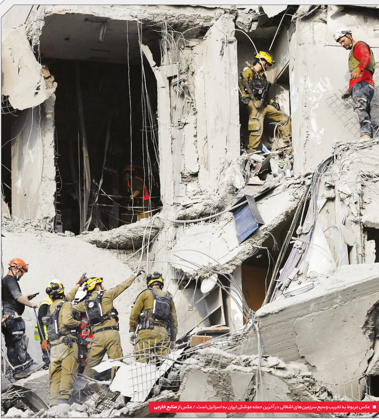
عکس مربوط به تخریب وسیع سرزمین‌های اشغالی در آخرین حمله موشکی ایران به اسرائیل است.